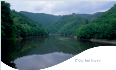
D'Our bei Biwels