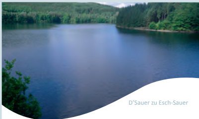
D'Sauer zu Esch-Sauer