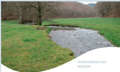
D'Himmelbaach bei Mäerkels