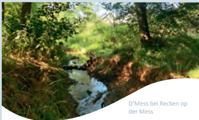
D'Mess bei Recken op der Mess