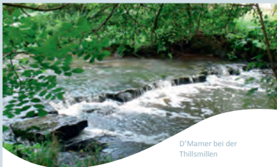
D'Mamer bei der Thillsmillen