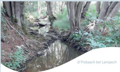
D'Pisbaach bei Lampech