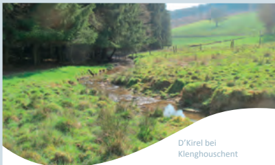
D'Kirel bei Klenghouschent