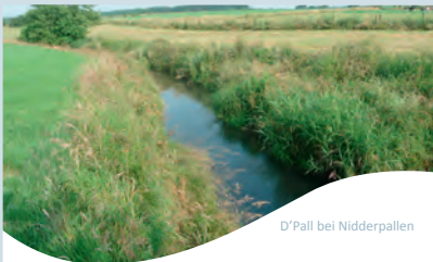
D'Pall bei Nidderpallen