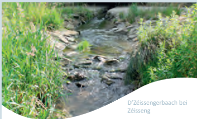
D'Zéissengerbaach bei Zéisseng