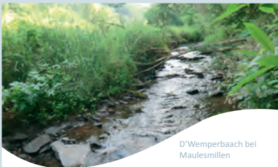
D'Wemperbaach bei Maulesmilen