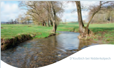
D'Koulbich bei Nidderkolpech