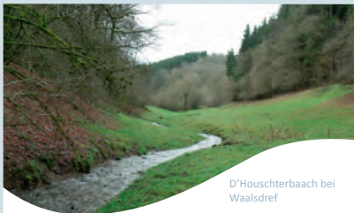
D'Houschterbaach bei Walsdref