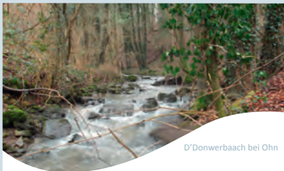
D'Donwerbaach bei Ohn