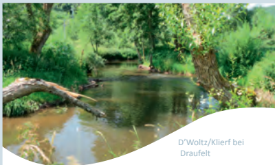
D'Woltz/Klierf bei Draufelt