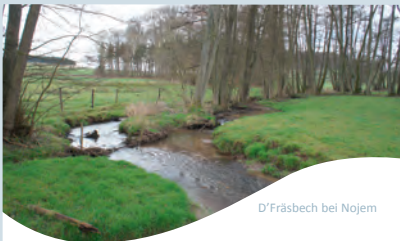
D'Fräsbech bei Nojem