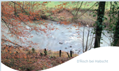
D'Äisch bei Habscht