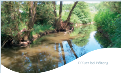
D'Kuer bei Péiteng