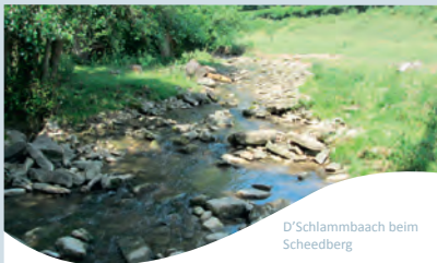
D'Schlammbaach beim Scheidberg