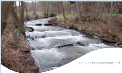
D'Blees bei Baastenduerf