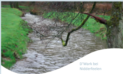
D'Wark bei Nidderfeelen