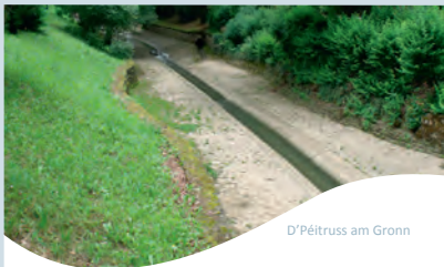
D'Pétruss am Gronn