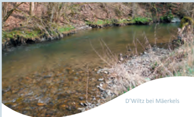
D'Wiltz bei Mäerkels