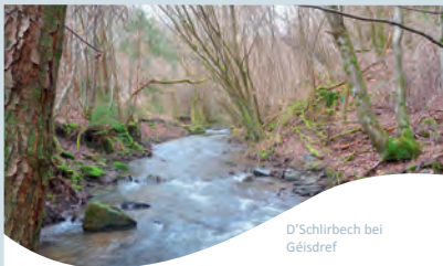
D'Schlirbech bei Géisdref