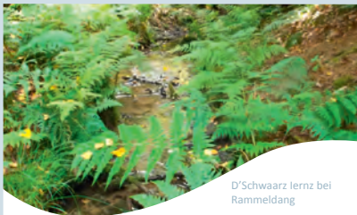
D'Schwarz Iernz bei Rammeldang