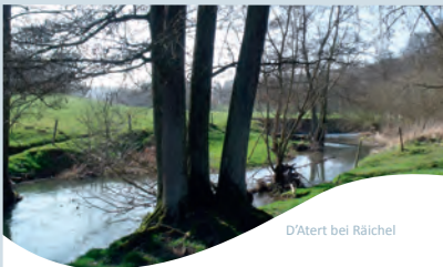
D'Atert bei Rächel