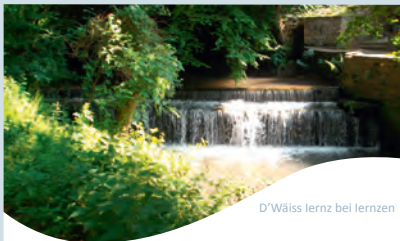
D'Wäiss Iernz bei Iernzen