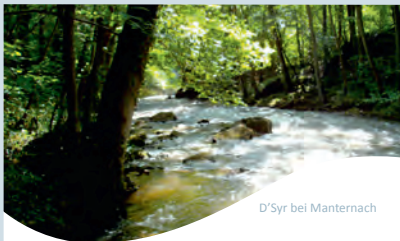
D'Syr bei Manternach