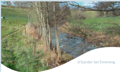
D'Gander bei Éimereng