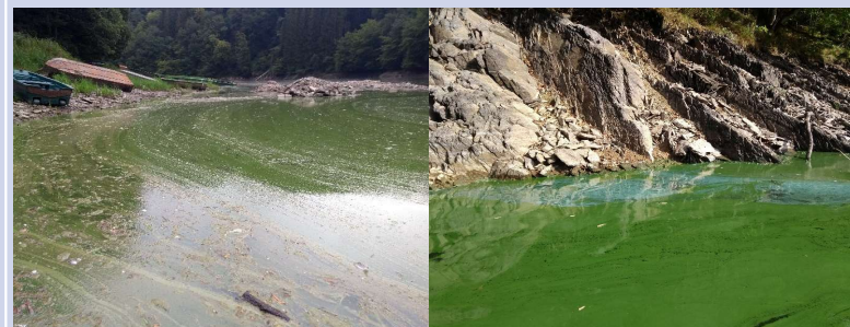
Lac Haute-Sûre 2021

L'efflorescence recouvre complètement l'eau et il n'est pas possible de voir celle-ci à travers l'accumulation de cyanobactéries. L'efflorescence représente une biomasse importante et une mauvaise odeur peut apparaître. Il peut y avoir une décoloration de l'efflorescence, un motif de couleur allant du vert clair au blanc et au bleu clair. Le risque d'une présence de fortes concentrations de toxines dans l'eau est élevé.