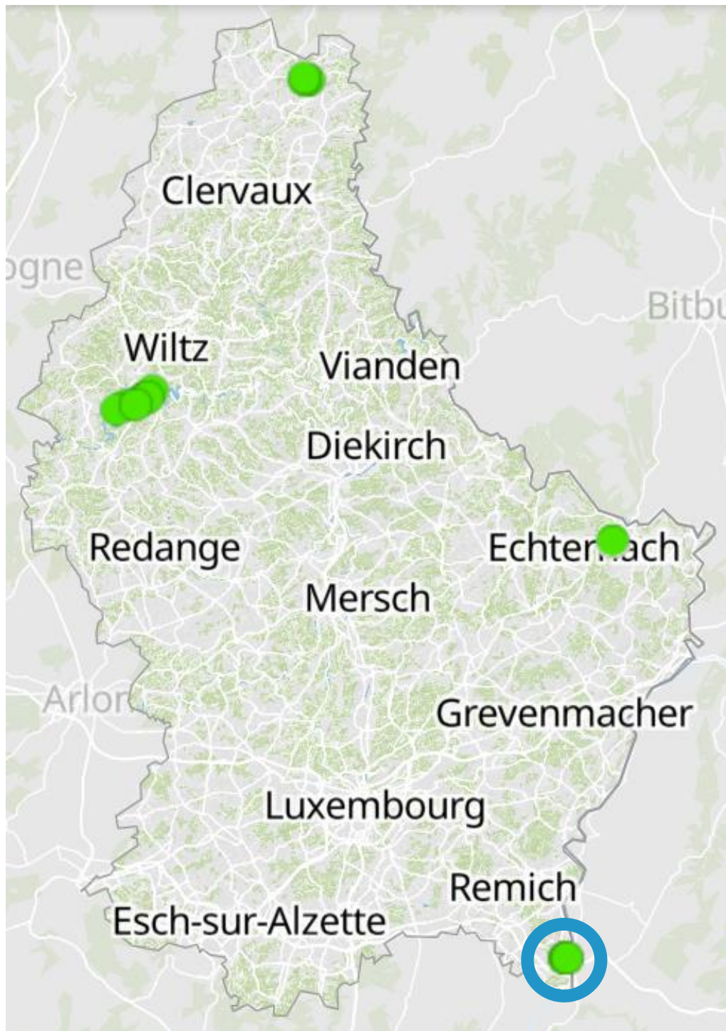
Carte 1: Localisation de l'étang de Remerschen (Baggerweier)