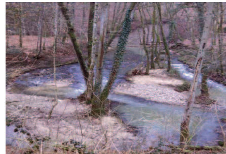
Ernz Noire (IV-3-K)