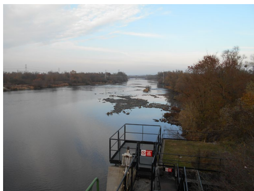
La Moselle non naviguée à Argancy en novembre 2018

La carte synthétique ci-après montre les résultats du suivi hebdomadaire pour une année – ici en exemple l'année 2015 – avec un diagramme circulaire pour chaque station de mesure des débits dans le bassin Moselle-Sarre pour pouvoir distinguer la situation d'étiage grâce à la couleur prédominante.