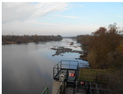
Die nicht befahrene Mosel in Argancy im November 2018

Die folgende Übersichtskarte zeigt beispielsweise die wöchentlichen Monitoring-ergebnisse für ein ausgewähltes Jahr – hier: 2015 – für jede Abflussmessstelle in Form von Kreisdiagrammen, sodass sich die Niedrigwassersituation im Mosel-Saar-Einzugsgebiet gleich anhand der vorherrschenden Farbe erkennen lässt.