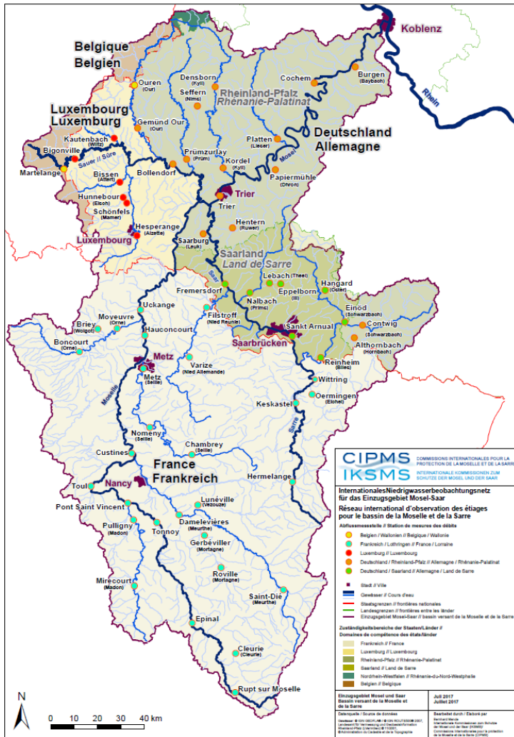
Karte 1: Niedrigwassermessstellen der IKSMS

Alle Daten der 59 Abflussmessstellen für die Kalenderwochen 18 bis 44 von 2015 bis 2017 werden der Öffentlichkeit in Kürze auf www.iksms-cipms.org zur Verfügung, und zwar in Form von Graphiken, Kreisdiagrammen, Tabellen und teilweise interaktiven Karten.